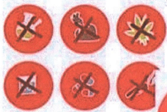
ПРОПАГАНДА НАРКОТИКОВ И АЛКОГОЛЯ